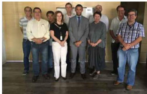
Diretores do Sinal-SP e o coordenador do projeto durante reunião

O Sinal Deseja um feliz dia das mães 13 de maio 2018