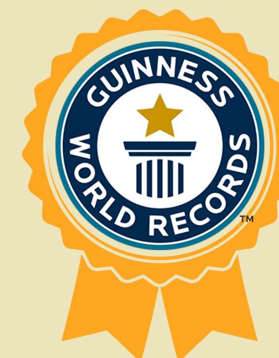
Premio Top of Mind - Revista amanhã