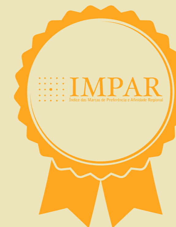
Prêmio Impar - Índice das Marcas de Preferência e Afinidade Regional