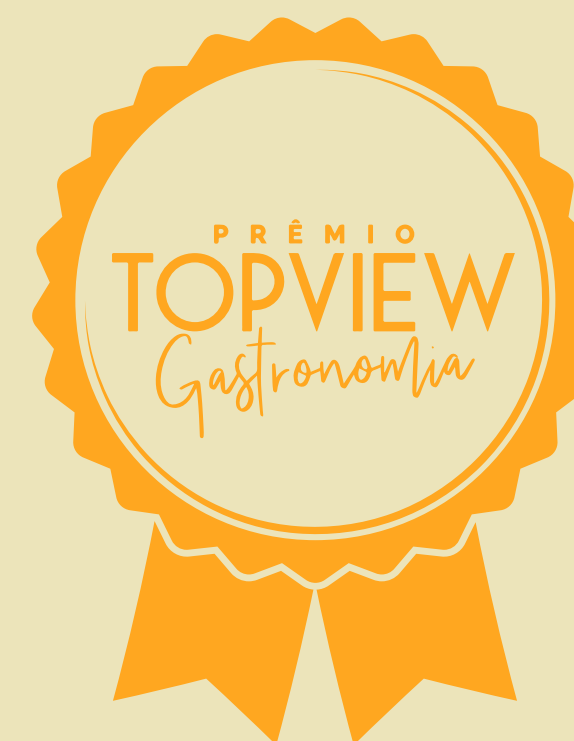
Premio Top View Gastronomia

MAIS DE R$ 65.000 doados para instituições como o Hospital Pequeno Príncipe