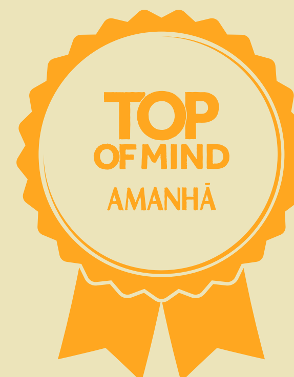
Premio Top of Mind - Revista amanhã